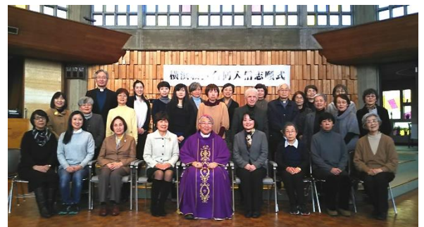
藤沢・片瀬・中和田教会の皆様