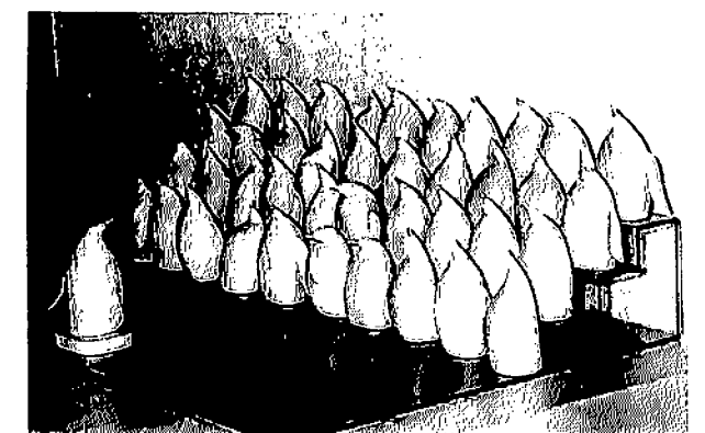
第12回丹波の森ウッドクラフト展入賞作品

(朝日新聞96年1月18日夕刊には「町の達人」として木馬作りの趣味が紹介されました。)